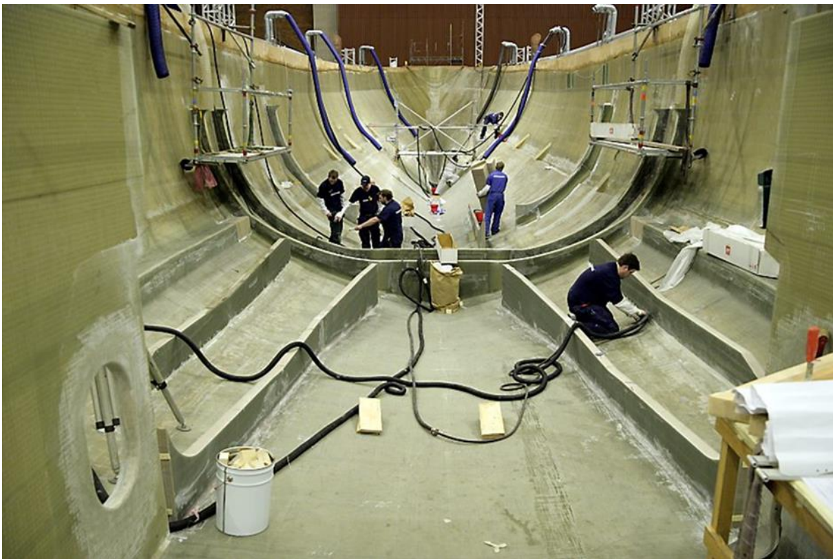
Montering av bordläggningsförstyvningar