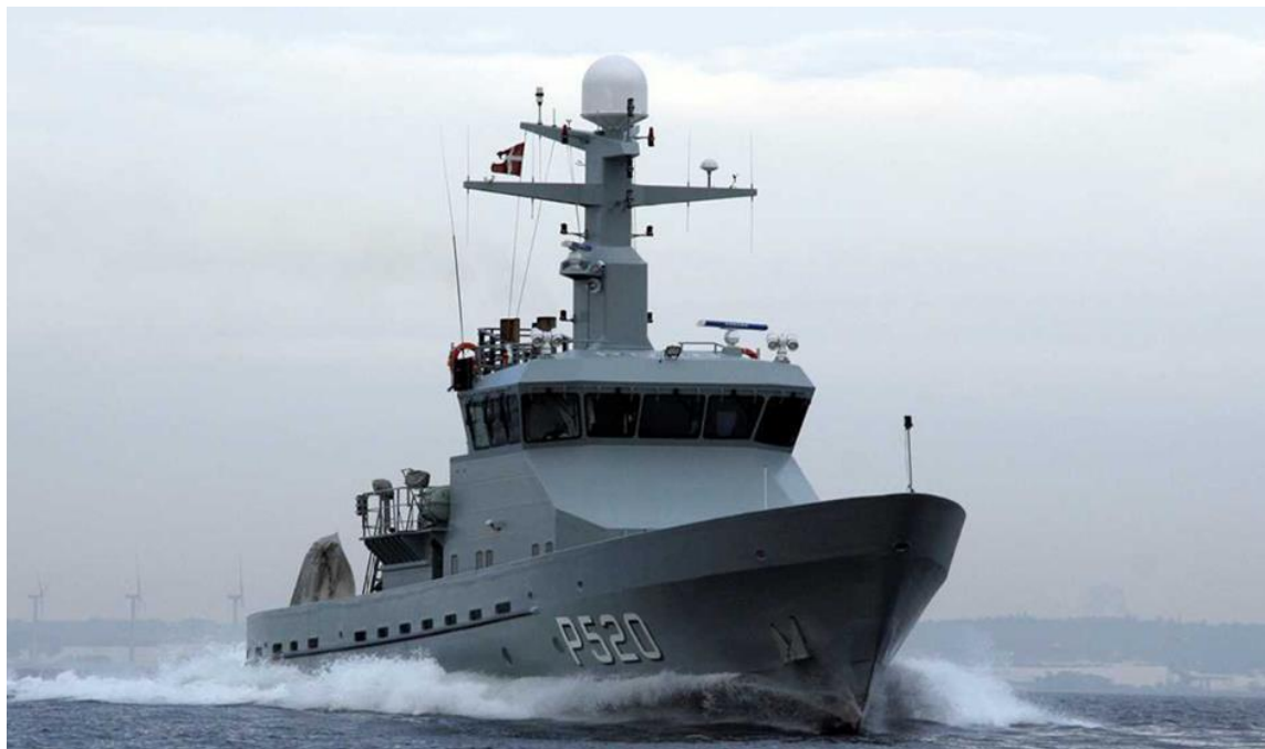
Patrullfartyget Diana

Diana-klass är en klass av danska örlogsfartyg byggda av Faaborg Værft i samarbete med Kockums i Karlskrona för danska Søværnet.