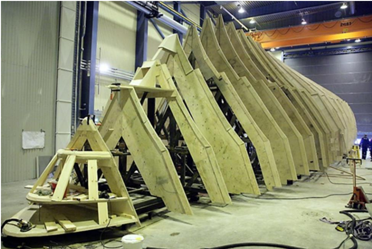
Mallstativet för bordläggning