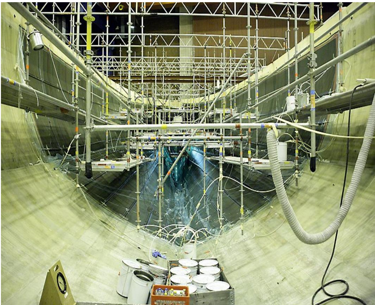
Vacuuminjicering av innerlaminat