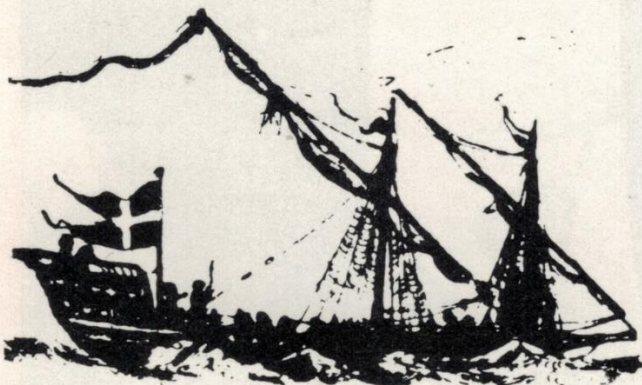
Galären Västervik — den moderna Västerviks närmaste föregångare — kämpade mot bl a ryssen under kriget runt 1800.

• Vesterviks Fortuna var inblandad i slaget vid Kolberger Heide 1644. Efter slaget skulle skeppet hämta öl, men den svenska flottan var inestängd av de danske. Danskarna lyckades också landsätta några kanoner som från långt håll fick in en träff på det svenska flaggskeppet Scepter. Skottet dödade amiral Klas Fleming som just stod och rakade sig.