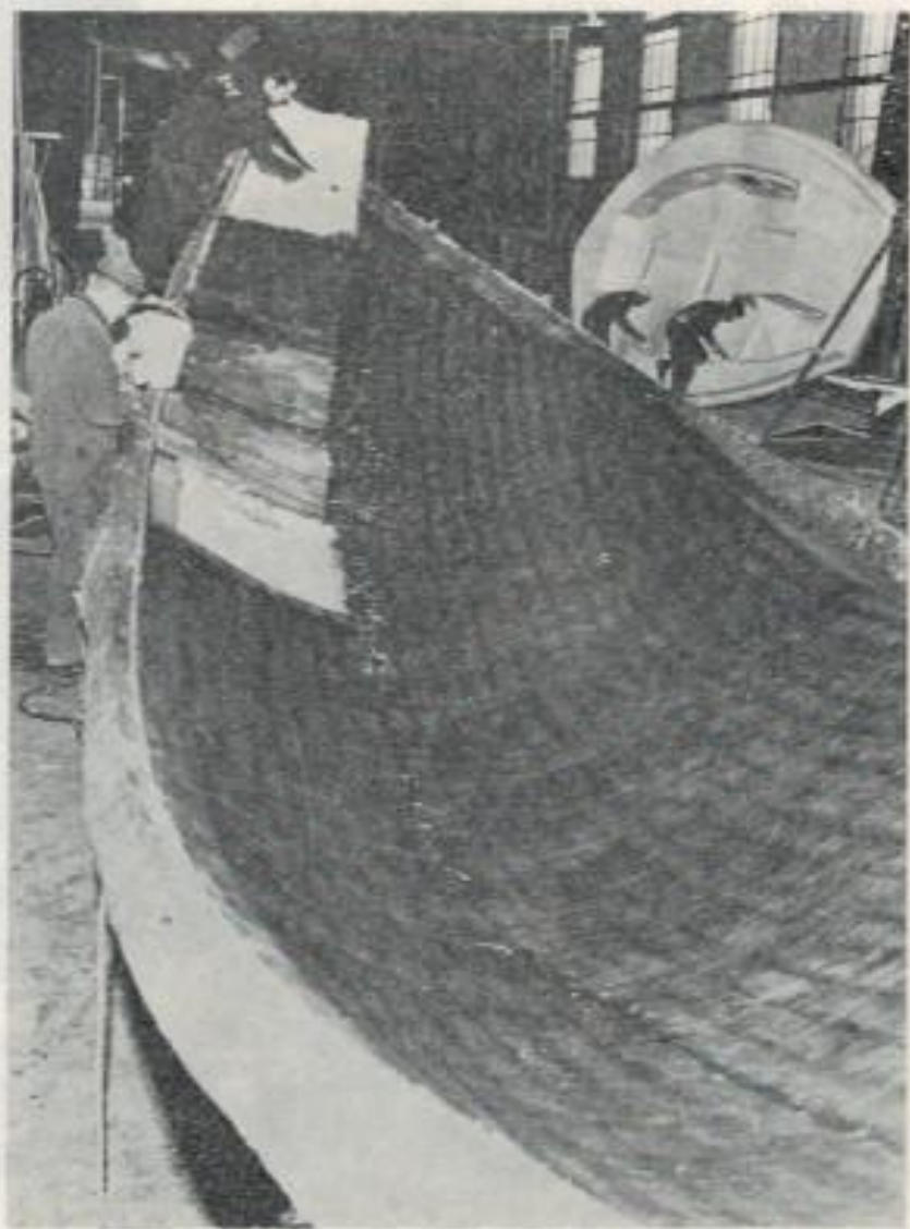
Skrov till OC 35 under tillverkning.