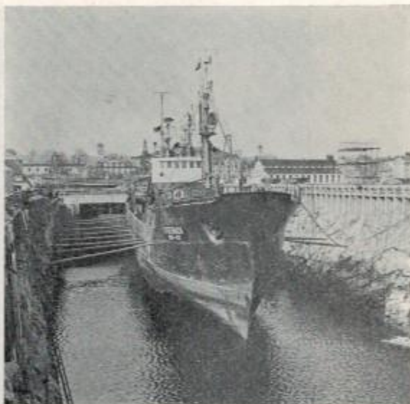
Civilreparert i Polhemsdockan.