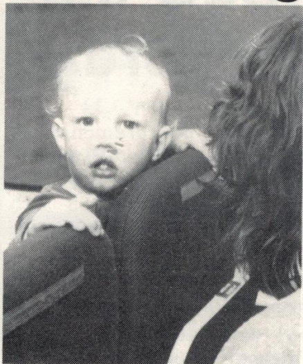
Mycket får man vara med om, också i unga år...