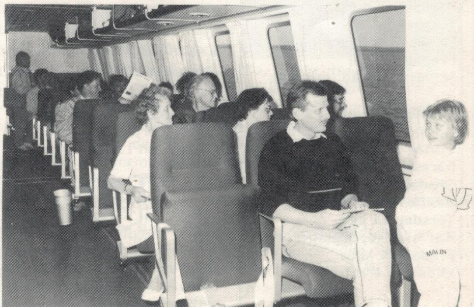
...eller så här lugnt och behagligt.