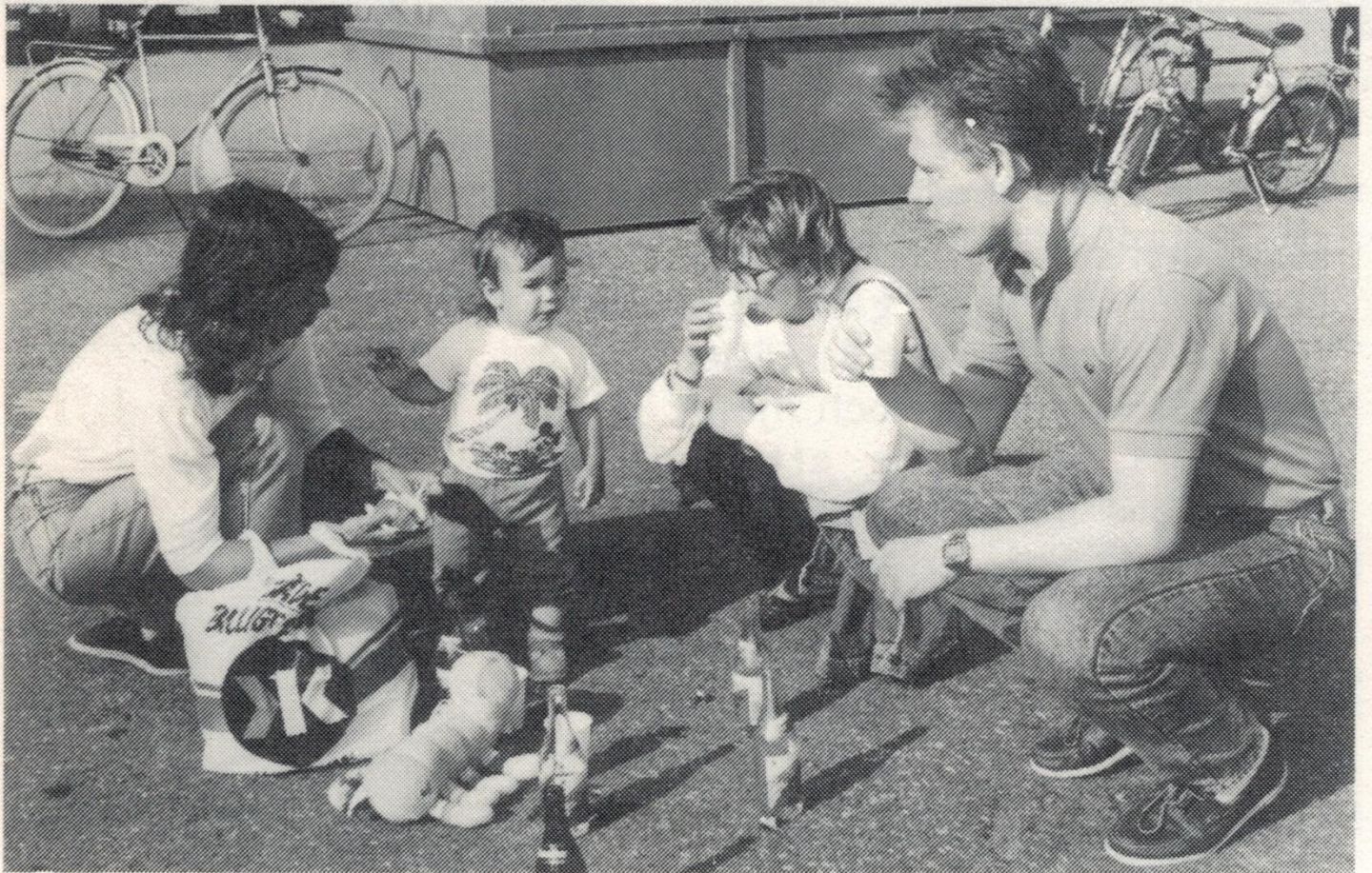
Picknick på varvet. Ingenting är omöjligt om man har lite fantasi.