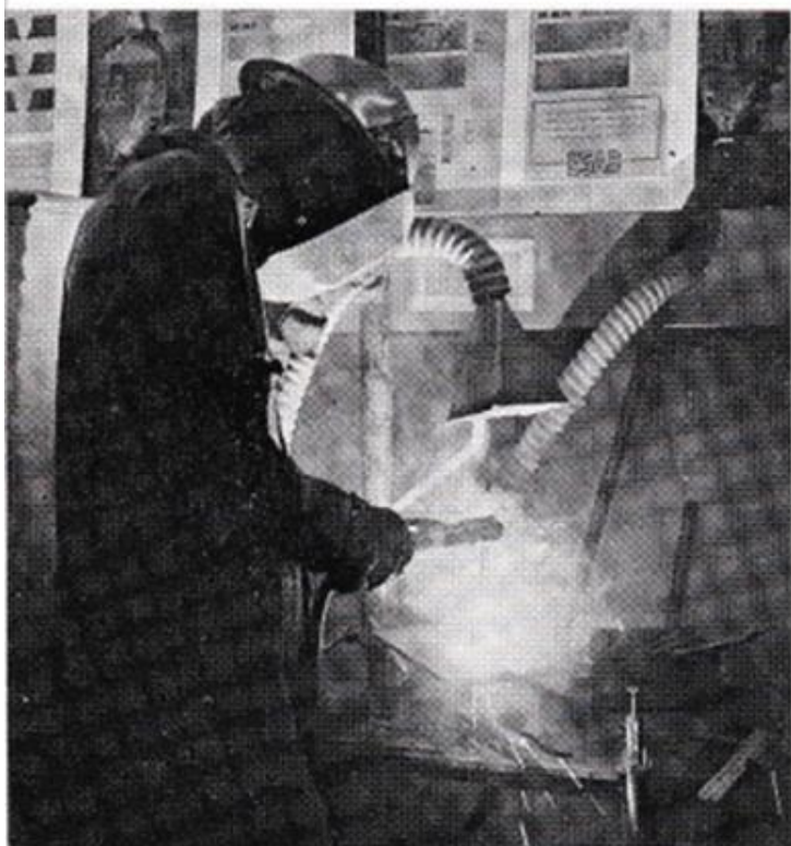
Även under — upp