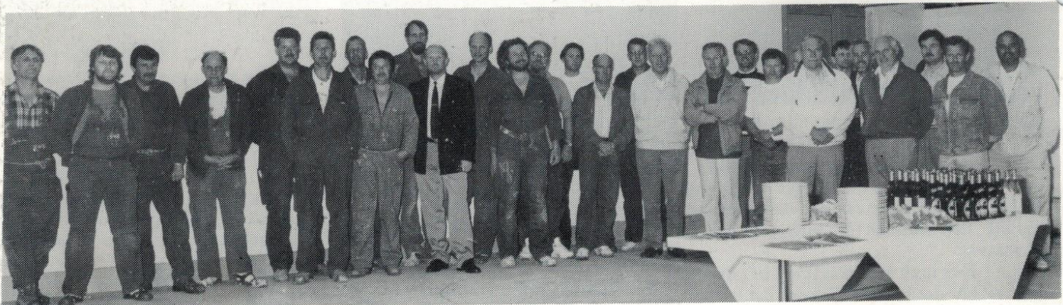
Alla berörda anställda och de som jobbat med den om- och tillbyggda ytbehandlingsverkstaden firade invigningen med smörgåstårter

I och med denna byggnad, så lämnar målarna sin gamla verkstad och all personal kommer att ha sin utgångspunkt i denna nya. Så småningom kommer också färgförrådet att placeras i anslutning till ytbehandlingsverkstaden.