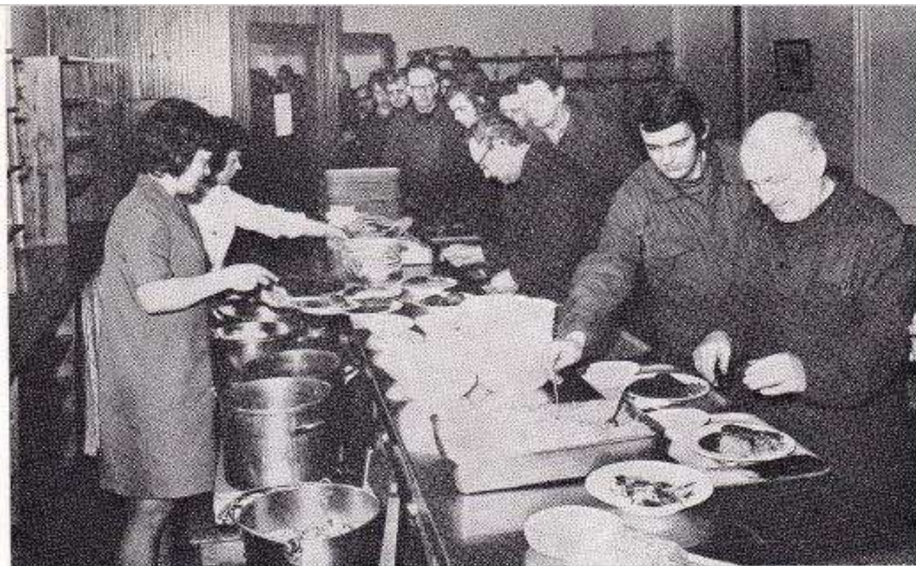
Älgstek till lunch uppskattades tydligen av gästerna.

personalen inte bör belastas med detta vid "rusningstid".