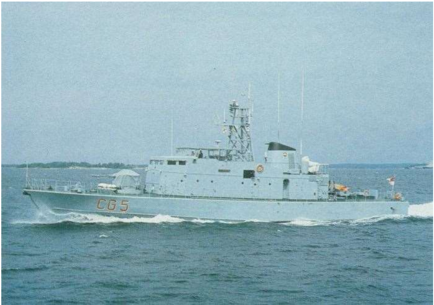
CG 40, Patrullbåtarna till Trinidad & Tobago med namnen BARRACUDA och CASCADURA