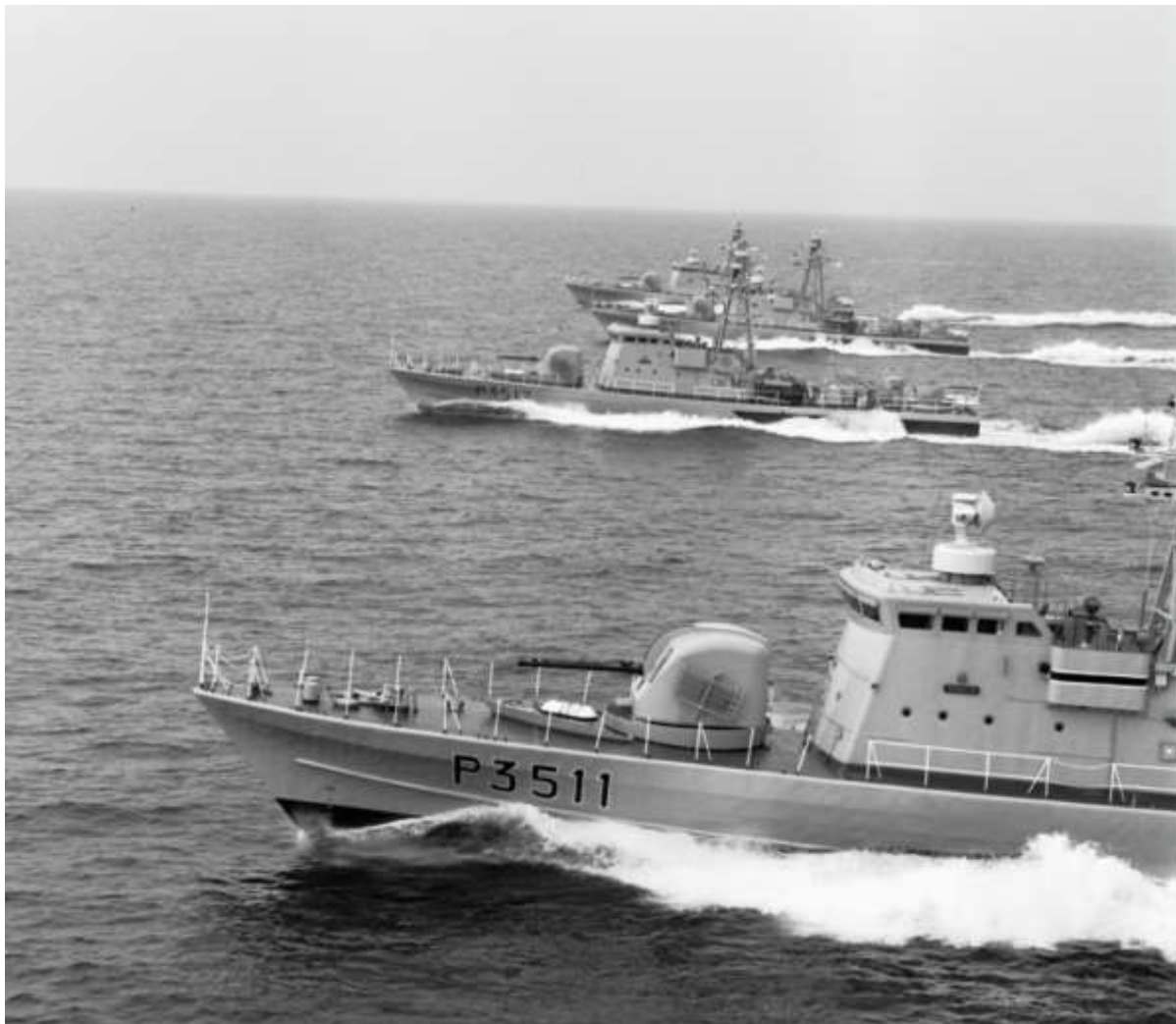
KD Handalan (3511), KD Perkasa (3512), KD Pendakar (3513) and KD Gempita (3514).