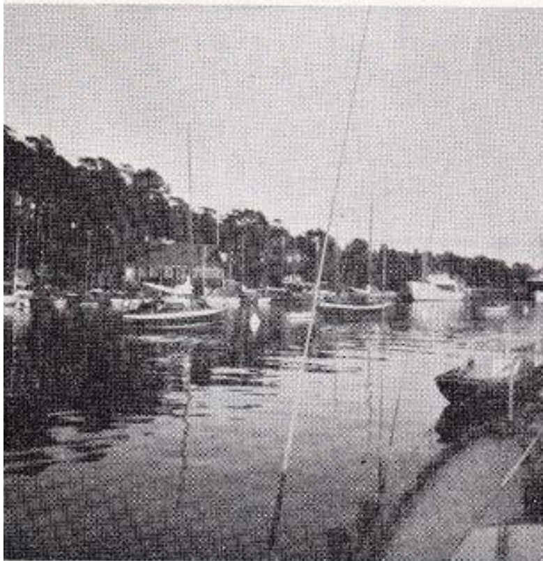
Vid boj hos Mariehamns Segelförening.

Den lördag—söndag som sedan följde blev dagar att minnas. Vädret blev åter det bästa tänkbara, "sommar i Skandinavien". Tidvis segling, omväxlande med motorgång, genomkorsades ett av Stockholms skärgårds mest omskrivna område från Dalarö genom Möjaleden över Rödkobbsfjärden till natthamnen Röd-löga. Söndag morgon loss tidigt, genom leden vid Kudoxa och Vidinge och så ut på Ålandshavet blå vid Söderarm. Vind sydväst, varmt, klart. Många båtar var på väg över, sträckan Remmargrund—Kobba Klintar är bara ca 25 distansminuter, många sorters farkoster gör turen, ofta flera i sällskap.