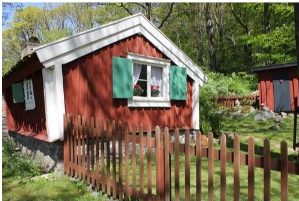
OW:s stuga efter flytten från Timmermansgatan till Wämöparken 1954

Vid 15 blev han lärling hos en smed i Kalvhagen. Arbetstiden var 11,5 timmar om dagen och lönen tre kronor i veckan. Han avlade sitt gesällprov, därefter blev det militärtjänstgöring vid Kustartilleriet och engagemang i fackföreningen. På grund av storstrejken 1909 miste han sitt arbete hos smidesmästaren. Så småningom anställdes han på varvet, engagerade sig i politiken allt mer och blev en av stadens mest inflytelserika politiker. Sin mest viktiga insats gjorde han som rektor för Centrala verkstadsskolan, som han byggde upp och ledde efter egna principer.