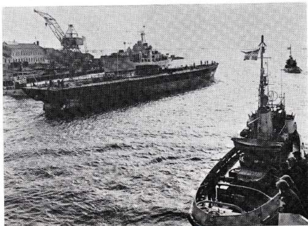
Älvsborg i sitt rätta element.

För övrigt kan noteras att första sektionen — förstäven — placerades på bädden i mars 1969. På grund av fartygets längd slädades den förliga delen ut utanför verkstadsbyggnaden strax före semestern, för att bereda plats till den aktra delen inomhus. Älvsborg sjösattes liksom ubåtarna med förstäven först — man fick längre tid för tillverkning av den mer komplicerade akterstäv. Fartygets storlek medförde, att det var olämpligt att bygga hela skrovet på bädden — bilden visar tydligt hur trångt det är i nybyggnadshallen. Nu sjösattes endast undre delen — upp till mindäck. Övre delen av skrovet och överbyggnaden hängs vid kaj med hjälp av utrustningskranen.