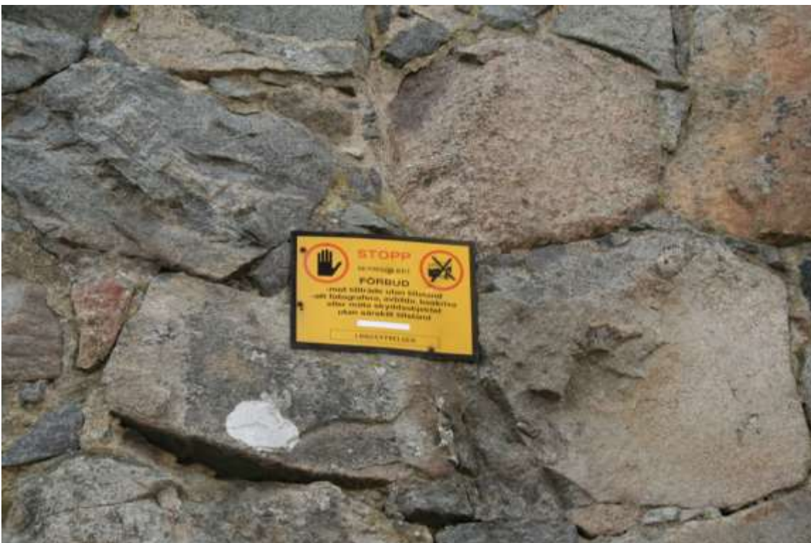
Varvsmuren med meningslös förbudsskylt

Från Västerudden på Trossö fram till Björkholmen och Saltösund byggdes under åren 1830–1838 Varvsmuren. Det är inte en befästningsmur utan helt enkelt ett ovanligt högt industristaket byggt i sten. Några ryska krigsfångar, som skulle varit med om att bygga muren, fanns inte i Karlskrona vid denna tid. Möjligen kan vissa krigsfångar varit med vid bygget av den äldsta delen av Sträckningsmuren på Trossö. Varvsmuren är ett helt vanligt entreprenadarbete.