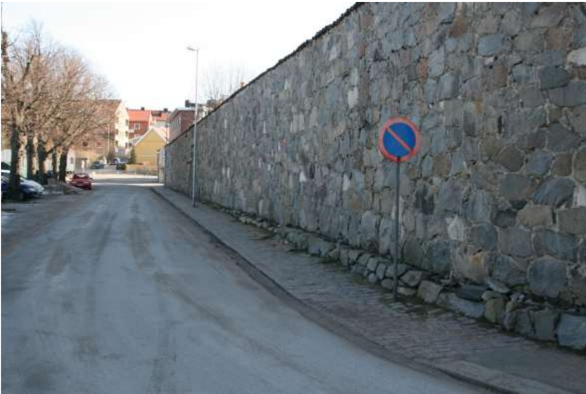
Varvsmuren vid Chapmansplan