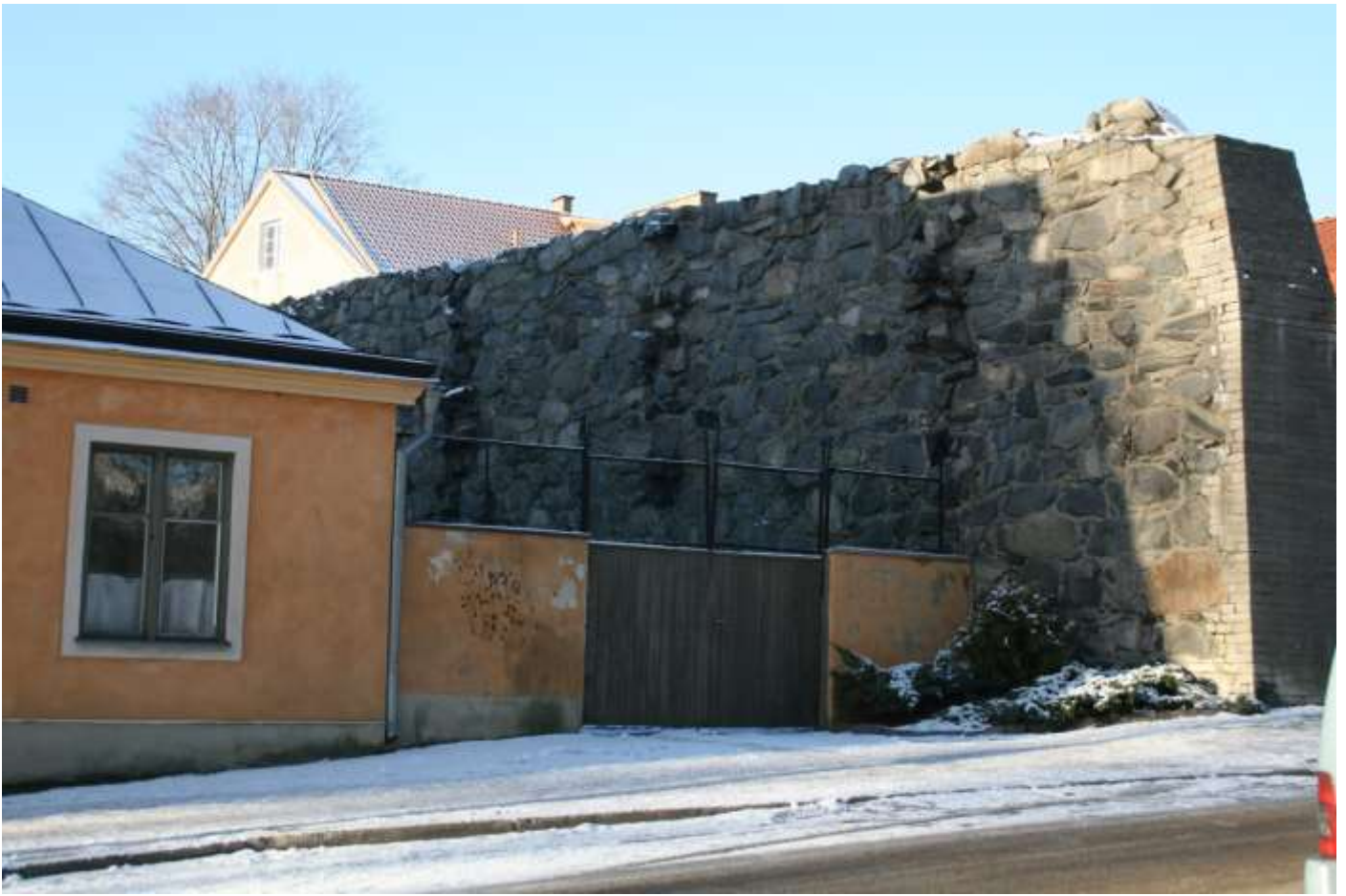
Sträckningsmuren vid Sjöofficersmässen