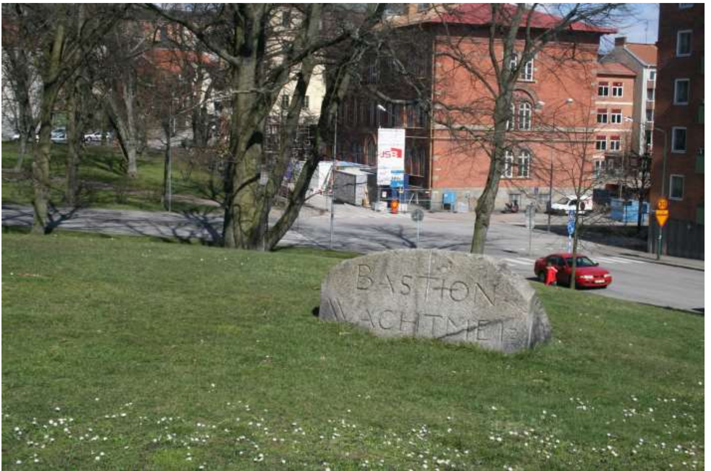
Bastion Wachtmeister, minnessten