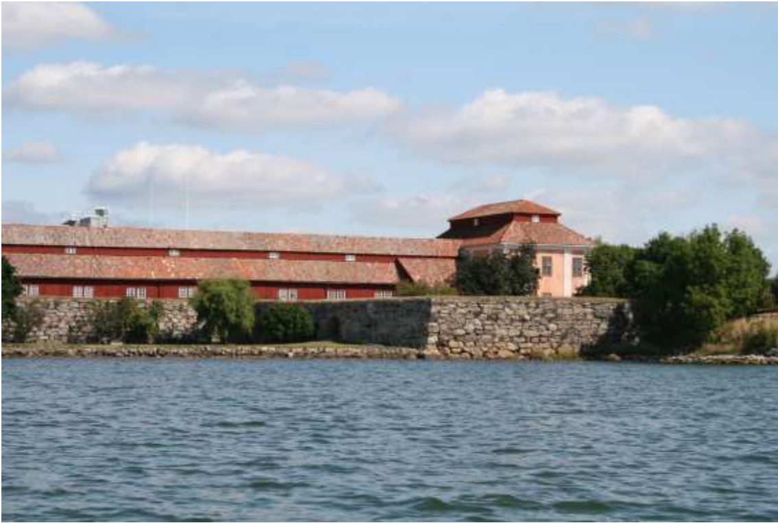
Bastionen Castor på Lindholmen

Castor låg på Lindholmen vid Repslagarbanans östra ände. Vissa spår återstår. Del av bastionen kom att användas som skjutbana för eldhandvapen.