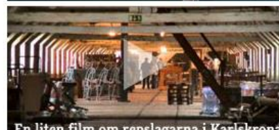
En liten film om repslagarna i Karlskrona