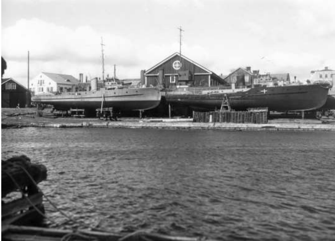
Torpedbåten Havskatten har sliptagits på torpedbåtslipen vid Karlskrona örlogsvarv. Till vänster en av kustartilleriets A-slupar