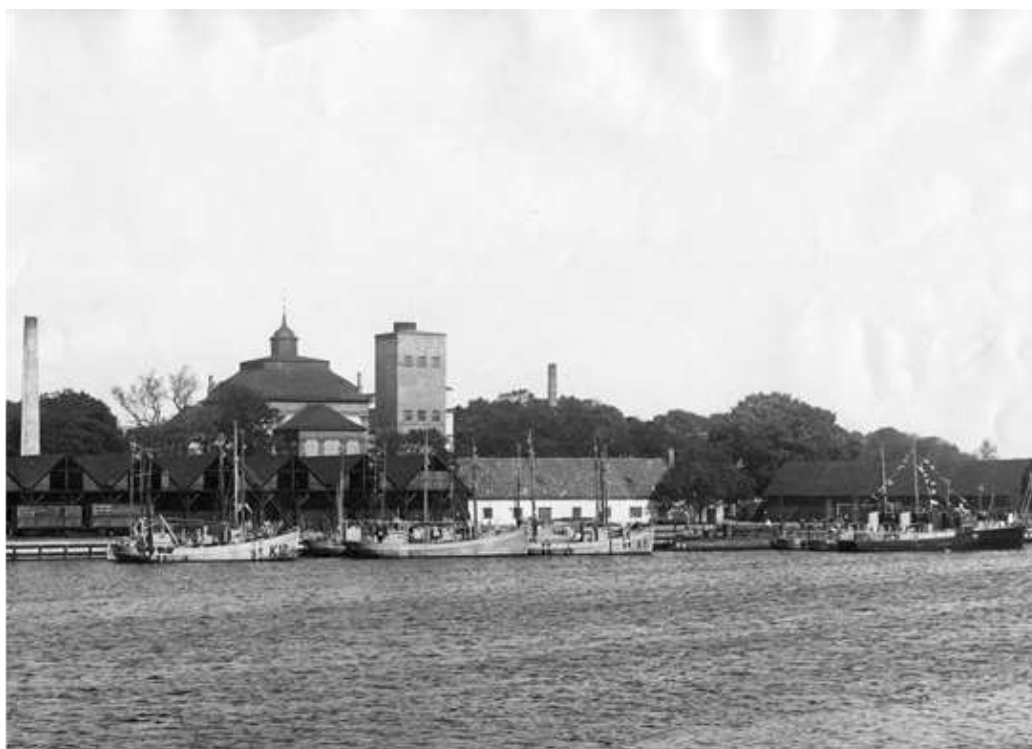
Danska eskadern vid mobiliseringskajen Örlogsvarvet i Karlskrona 1943. Till höger torpedbåten Havskatten, till vänster en minsvepare

Tanken var att bilda en marin enhet av de fartyg och den personal ur flottan, som flytt till Sverige. I slutet av februari 1944 samlades befäl och manskap om cirka 150 man på Sättra brunn utanför Sala för att utbildas. En styrka om 24 man blev kvar i Karlskrona för tillsyn och översyn av fartygen.