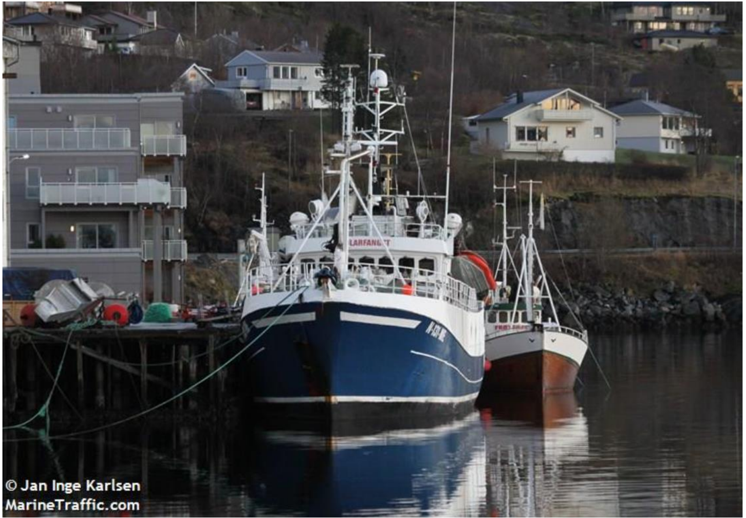
Astrid II, nu med namnet Polarfangst

2018 -12-09 låg hon i hamn i Kristiansund.