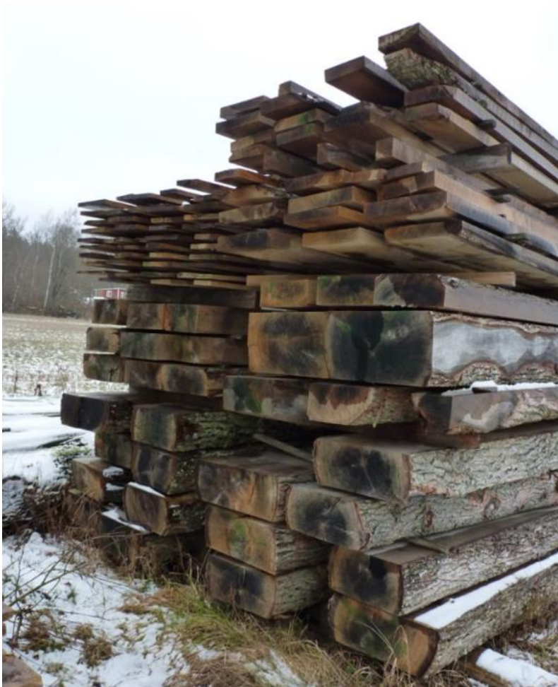
Tidigare sågade ekstockar som skänkts av Karlskrona Kommun ligger nu för torkning