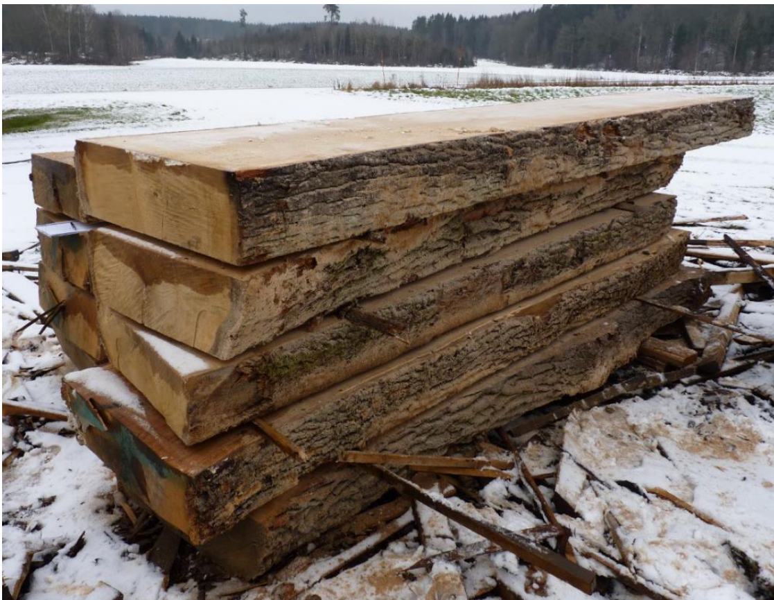
Ekstockar som sågats för att bli de grövsta spanten i rekonstruktionen