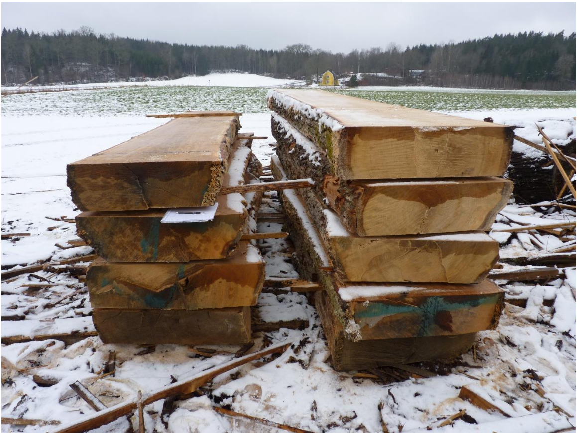
De grövsta ekstockarna har en diameter runt 80 cm och är mycket svåra att få tag på